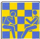
Club 64 A.S.D. Modena

Ritrovo ogni martedì-giovedì sera (ore 21-00.30) e ogni sabato (ore 15-19) presso la sede della Pol.S.Faustino, Via Wiligelmo 72.