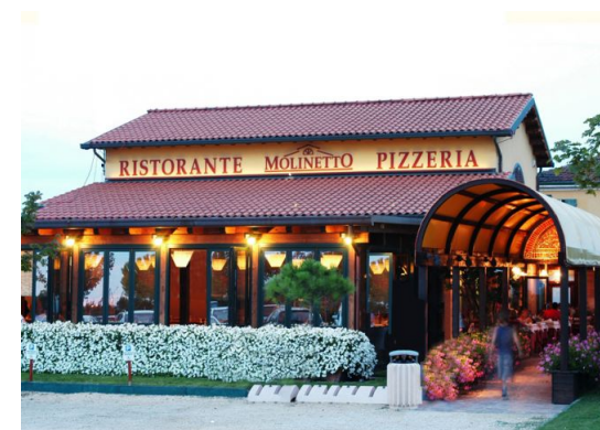
Ristorante Molinetto -Via Sx Canale Molinetto 139/ Punta Marina (Ravenna) el. 0544 430248

1° Assoluto: € 300+ targa 2° Assoluto: € 200 3° Assoluto: € 150 4° Assoluto: € 130 5° Assoluto: € 100 1° giocatore tesserato F.S.I. Fascia elo 1700-2000 € 80 Con elo <1700 : € 40